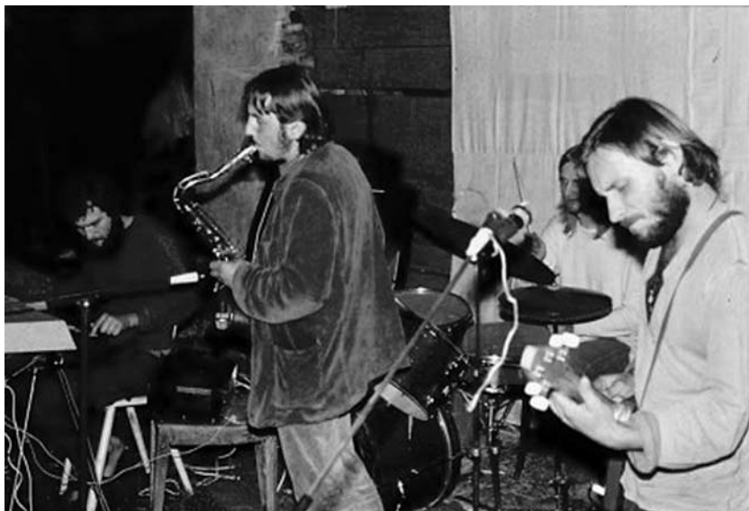
Koncert Třanovice, 1982

Hudebním vystoupením v Pomezí se ale éra skupiny Walt Whitman Band završila. Někteří členové ukončili činnost z důvodu nástupu na vojenskou službu, jiní se hudbě nechtěli věnovat, protože návštěva zkušebny v Dolních Kounicích byla finanční a časovou zátěží. Pro StB tento koncert znamenal impuls k další šikaně nových tváří undergroundu. Úhelným kamenem aktivit se staly Dolní Kounice, kde pomocí tajných spolupracovníků, občanů a Pomocné stráže Veřejné Bezpečnosti získávala StB nové poznatky a informace. Další zásah měl přijít před připravovanou výstavou amatérských výtvarníků v prostorách kláštera Rosa coeli.