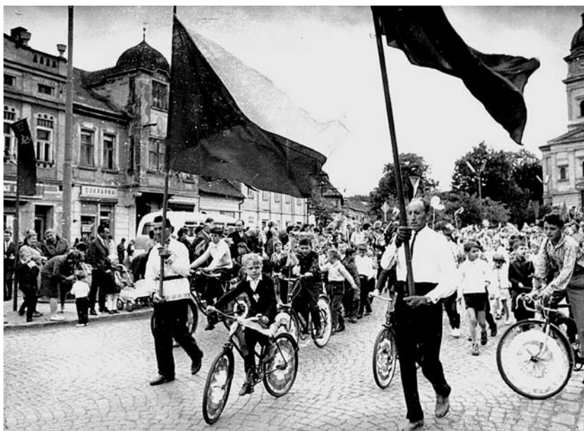
První máj 1968

To nadějně jaro 1968 bylo prosyceno pronikavou vůní šěříků provázející každoroční komunistické orgie Svátku práce a osvobození. Avšak v tom období bylo cítit více příjemné vůně ve vzduchu. Byla to atmosféru nádechu svobody, která se zvolna dostávala lidem pod kůži. Nejen reformním komunistům, jimž svítala ošidná naděje na novou obrodu jejich popularity jako v roce 1948, ale i celému zbytku společnosti devastované a unavené bolševickým zasmrádlým režimem. Těm, kteří dělali kulturu nebo jí žili, svítaly lepší časy. V rádiu bylo slyšet bigbeat, na stáncích a v trafikách se prodávaly fotky kapel a hudebníků s dlouhými vlasy ze Západu a kalendáře